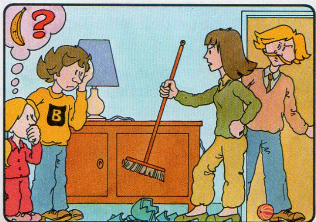
Maman dispute les enfants