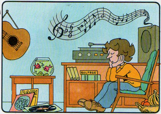
Bruno écoute de la musique